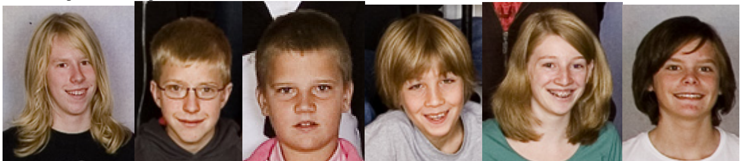
Wien, im September 2011.

13) Gegeben ist das rechtwinklige Tetraeder ABCD[A(49|0|0), B(0|98|0), C(0|0|147), D(0|0|0)], dessen vier Begrenzungsflächen die Flächeninhalte F_{\Delta ABC} , F_{\Delta ACD} , F_{\Delta BCD} sowie F_{\Delta ABD} aufweisen. a) Verifiziere, dass dann F_{\Delta ABD}^2 + F_{\Delta ACD}^2 + F_{\Delta BCD}^2 = F_{\Delta ABC}^2 (Verallgemeinerung des pythagoreischen Lehrsatzes für rechtwinklige Dreiecke aus der Ebene für rechtwinklige Tetraeder im Raum) gilt! b) Mit den Bezeichnungen h=d(D, \epsilon_{ABC}) (Normalabstand!), a = \overline{AD} , b = \overline{BD} und c = \overline{CD} läßt sich beweisen [Wer dies probiert und – ansatzweise – erfolgreich ist, kann mit einem gehörigen BONUS rechnen, was auch für einen Beweis von Aufgabenteil a) gilt, wobei dazu lediglich A(a|0|0), B(0|b|0), C(0|0|c), D(0|0|0) angesetzt werden braucht!], dass \frac{h^2}{3} = a^2 + b^2 + c^2 - \frac{a^4 \cdot w_a^2 + b^4 \cdot w_b^2 + c^4 \cdot w_c^2}{4 \cdot F_{\Delta ABC}^2} gilt, wobei hier w_a , w_b bzw. w_c für die Länge jener Tetraederkante steht, welche zur Kante mit der Seitenlänge a, b bzw. c windschief verläuft. Verifiziere diese Formel am vorliegenden konkreten Beispiel!